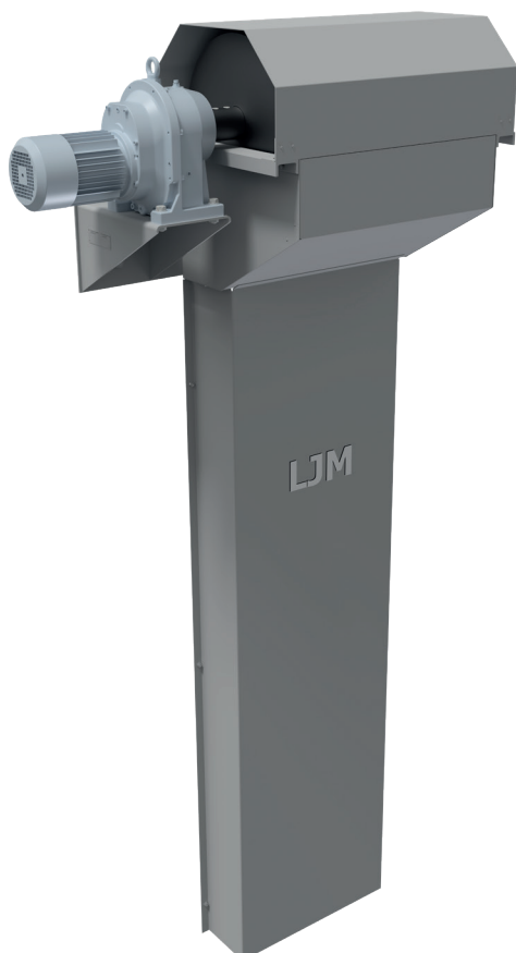
Trækstation WAP 2, væghængt